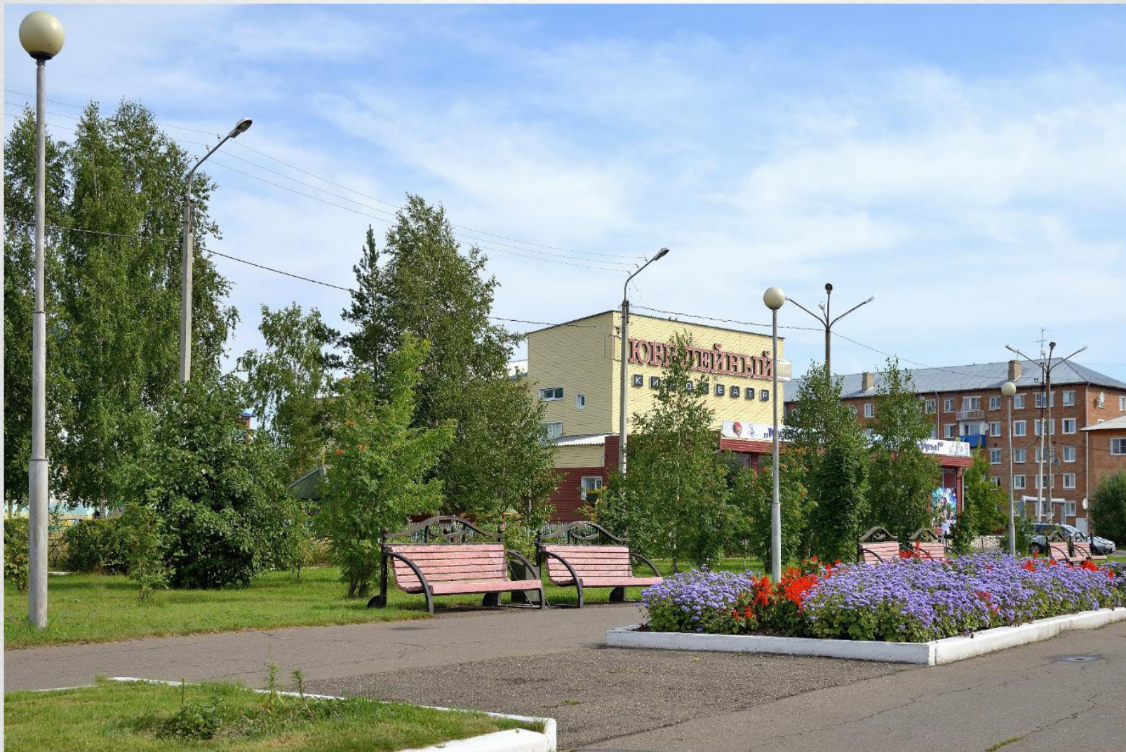
Сквер по ул Ленина

Я люблю свой город за уют и красоту природы