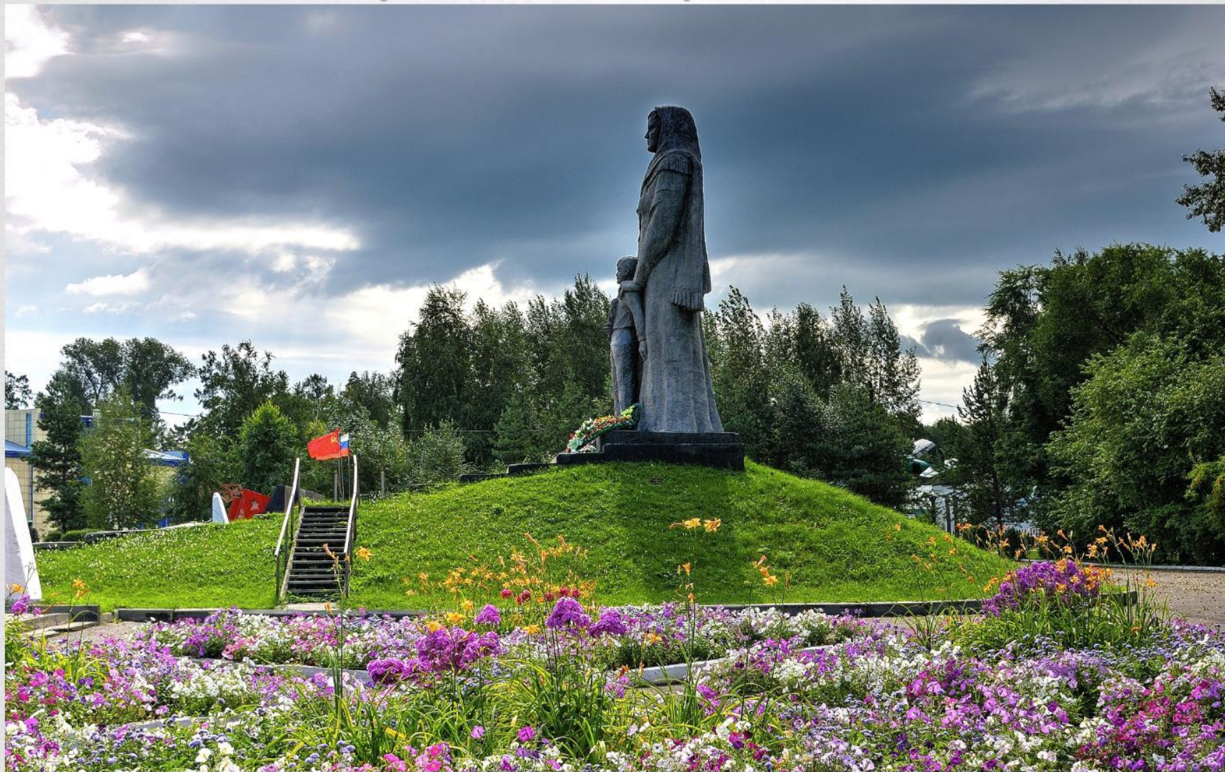
Памятник “Скорбящая Мать”

В годы Великой Отечественной войны из нашего города много людей уходило на защиту Родины